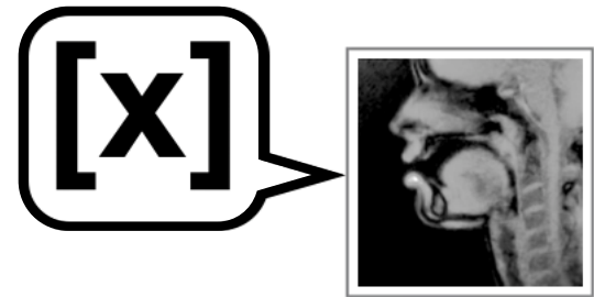
Zunge bildet eine Enge am weichen Gaumen (hinten, oben) Luft fließt stark durch die Enge und erzeugt [x]

Aufgabe 2: Hören Sie die Wörter mit [ç]. Hören Sie noch einmal und sprechen Sie.